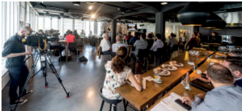
Die Teilnehmenden in der Wirtschaft Ziegelhütte in Zürich.

Beim ersten Branchenworkshop des Projekts Savoir - Faire tauschten sich Fleischfachleute und Gastronomen über die Herausforderungen und Chancen des Nose - to - Tail - Konsums aus – ein Trend mit viel Potenzial.